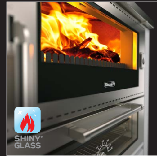
Feuerraumtür mit doppelt verglastem und selbstreinigendem Sichtfenster Shiny Glass®