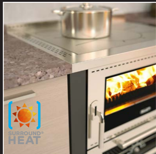
Surround Heat® System für eine max. Einbau-Sicherheit zwischen den Möbeln