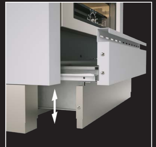
Teleskop-Sockel mit integrierter Holzlade (Serie MZ)