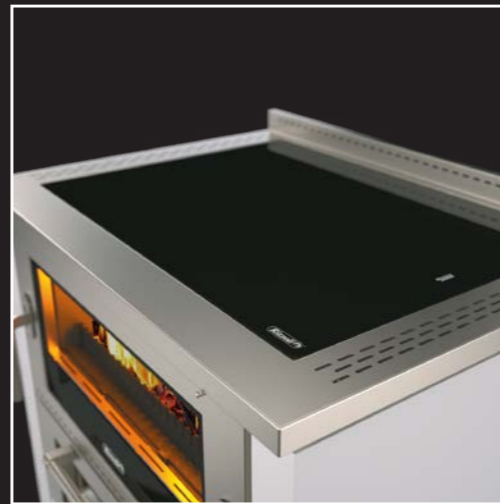
Hochleistungsfähige Stahl-Herdplatte oder Glaskeramik-Herdplatte