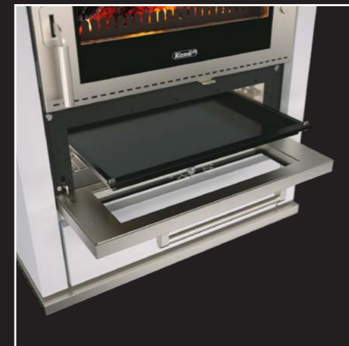
Großer Edelstahl-Backofen mit Innenbeleuchtung, Backblech auf Teleskopschienen und Grillrost