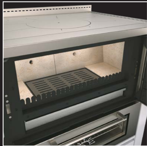
Großzügige und hochwertige Schamottierung der Brennkammer und der doppelten Rauchzüge