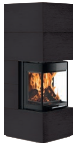
Club UH-550 conSTONE Schiefer