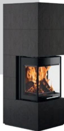
Club UH-550 Sintered Stone Schiefer