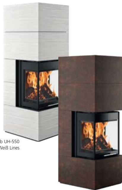
Club UH-550 conSTONE Weiß Lines

Der Hight-Tech-Werkstoff Sintered Stone und der hochwertige Betonwerkstoff conSTONE ermöglichen eine Vielzahl an Gestaltungsmöglichkeiten. Da ist für jeden individuellen Stil etwas dabei.