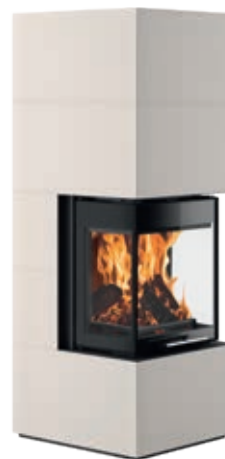
Club UH-550 Sintered Stone Seidenweiß