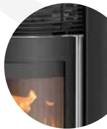
Ergonomischer Stangengriff und massive Gusstür mit Edelstahl-Einfassung