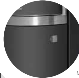
Massive Gusstür Holzlegefach