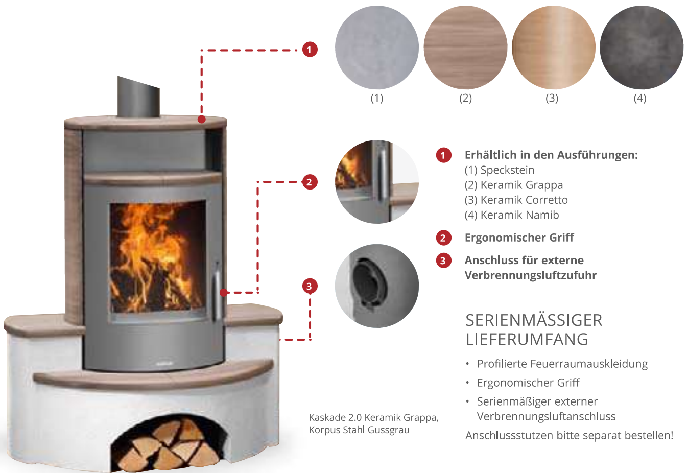
Kaskade 2.0 Keramik Grappa, Korpus Stahl Gussgrau