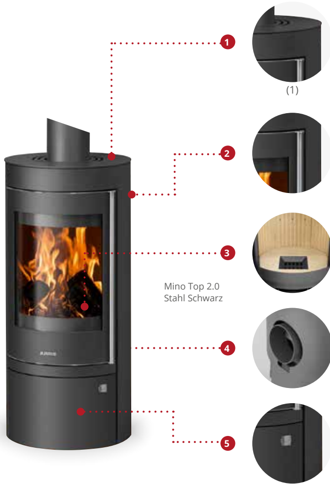
Mino Top 2.0 Stahl Schwarz