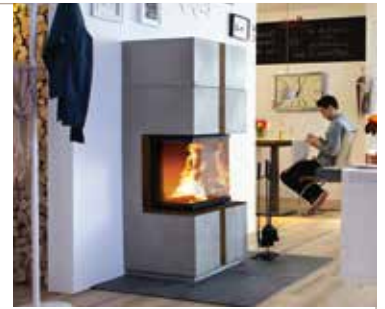
Abbildung: Gestaltungsbeispiel mit Frontapplika- tion in Rostoptik. Individuell für alle Camina Speichersteinmodelle möglich!