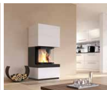
Abbildung: S12 Kurz in Kombination in Designbeton Oberflächenveredelung: Camina Silikatanstrich