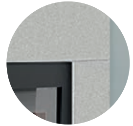
Bausatz-Elemente aus Leichtbeton (Anstrich erforderlich!)

Der Anschlussstutzen ist im Lieferumfang nicht enthalten.