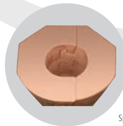
Speicherstein W+ (optional erhältlich)