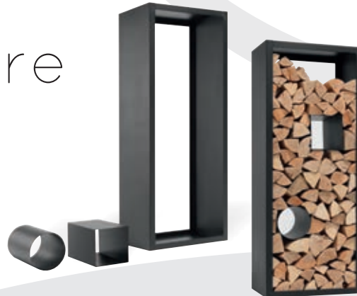
Optionales Zubehör: Holzregal