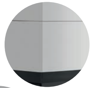
Bausatz-Elemente aus Leichtbeton (Anstrich erforderlich!)

Der Anschlussstutzen ist im Lieferumfang nicht enthalten.