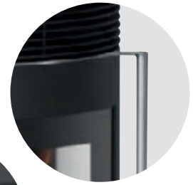
Ergonomischer Stangengriff und massive Gusstür mit Edelstahl-Einfassung

Der Anschlussstutzen ist im Lieferumfang nicht enthalten.